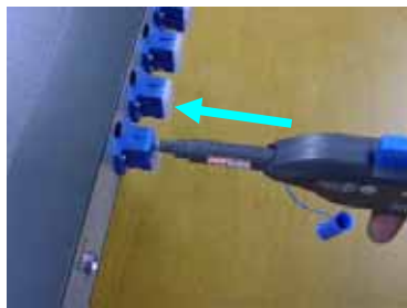
Fig. 1 正しい挿入方法