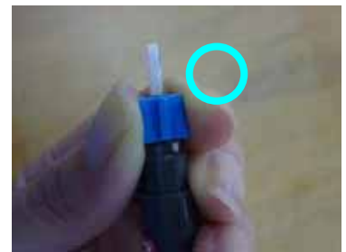
Fig. 2 間違った挿入方法